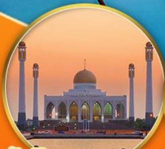
มัสยิดกลางสงขลา