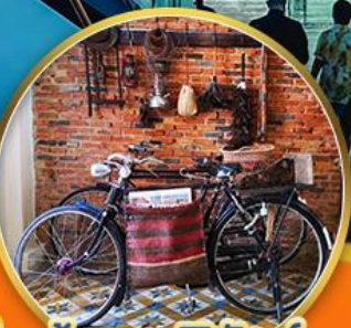
บ้านขุนพิทักษ์